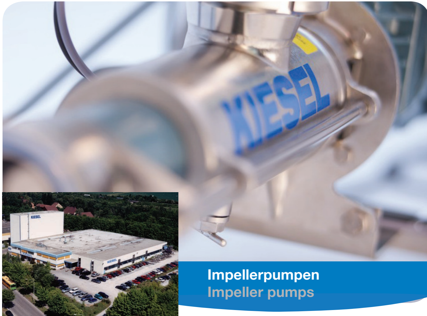
Impellerpumpen Impeller pumps